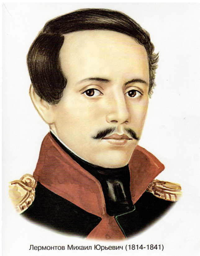
Лермонтов Михаил Юрьевич (1814-1841)